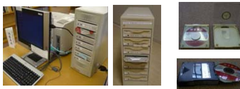
第 2 図 CD-ROM 関連機器

情報検索サービスの提供に際し、システムに対応するパソコン、OS、再生装置などの多様な機材が導入され、短期間の間に入れ替わっていった。(第 2 図)に CD-ROM 関連機器の例を示す。左から、CD-ROM サーバー、CD ケース対応の CD-ROM サーバー、CD ケース、6 連装 CD チェンジャーである。これらの機材を買い揃えてパソコンに接続し、情報検索サービスを提供するのは簡単な作業ではなかったが、インターネットでこうした作業は軽減した。